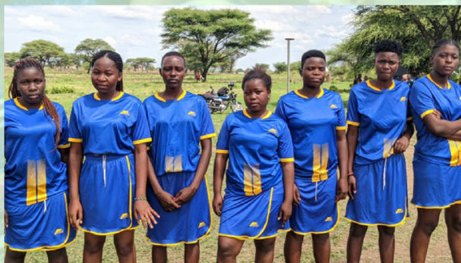
Timu ya wanafunzi ya mpira wa pete ya astashahada ya uongozaji watalii na uwindaji wa kitalii