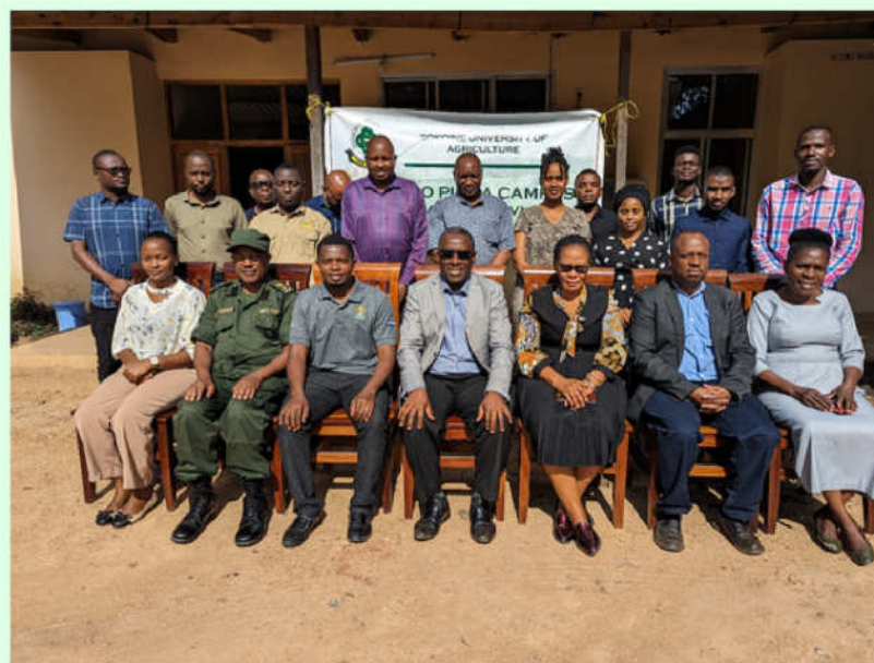
Katika picha ni washiriki wa Warsha ya kuboresha mitaala ya Elimu iliyoandaliwa na chuo kikuu cha Sokoine cha kilimo (SUA)Kampasi ya Mizengo Pinda ilifanyika Mkoani Tabora.

Mitaala hiyo inawapa wanachuo fursa za kujifunza kwa vitendo na kushiriki katika shughuli za ufugaji wa nyuki. Wamesema kuwa wamepata fursa za kufanya mafunzo kwa vitendo katika maabara, shamba darasa, na mashamba ya wafugaji wa nyuki. Pia, wamepata fursa za kushiriki katika ziara za kiufundi, semina, warsha, na maonesho ya ufugaji wa nyuki. Zaidi, mitaala hiyo inawakabili wanachuo kwa changamoto mbalimbali za ufugaji wa nyuki. Wamesema kuwa wamekutana na changamoto kama vile uhaba wa vifaa vya ufugaji wa nyuki, uhaba wa rasilimali fedha na watu, uhaba wa tarifa na teknolojia, uharibifu wa mazingira na mabadiliko ya tabianchi, ushindani na udanganyifu katika soko la bidhaa za nyuki.