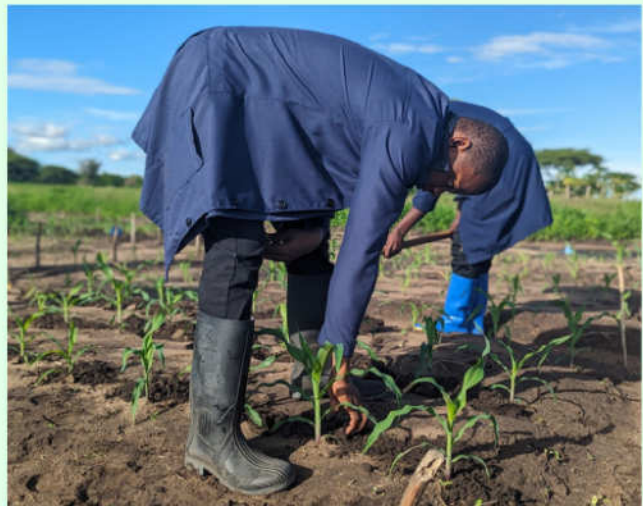
Mwanafunzi wa mwaka wa kwanza katika Stashahada ya Uzalishaji na Usimamizi wa Mazao akihudumia mimea ya mahindi katika jaribio dogo la mahindi katika kampasi

Kwa sasa kampasi hii inaendelea na Miradi miwili ya kiutafiti katika nyanja mbalimbali. Miradi hiyo ni pamoja na mradi unaolenga kutambua njia za asili zitakazosaidia kudhibiti uharibifu na upotevu wa mazao baada ya mavuno usababishwao na wadudu aina ya viwavijeshi. Mradi huu unajulikana kama (Integrated Traditional Package for Controlling Maize weevil ( Stophiluszea ) to reduce post harvest losses at Katavi region). Mradi mwingine wa kiutafiti umelenga kuja na njia za kitaalamu kwa kutumia TEHAMA katika uchaguzi wa mbegu bora zenye kuhimili magonjwa. Mradi huu unajulikana kwa jina la (To wards Breeding for Fall Armyworms resistant Maize varieties) A deep learning computer model for acceleration of the selection cycle). Miradi yote miwili inafadhiliwa na "SUARIS" kupitia mapato ya ndani ya Chuo.