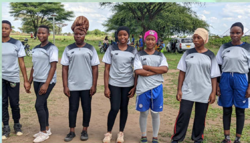
Timu ya wanafunzi ya mpira wa pete ya shahada ya awali ya sayansi ya usimamizi wa rasilimali nyuki